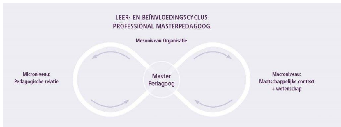
[FIGUUR2 UIT ZER VAN DE LEMNISCAAT]

Om verbetering en vernieuwing in de beroepspraktijk teweeg te brengen, vervult de masterpedagoog een cruciale rol op het niveau van de instelling (mesoniveau). Deze rol is te omschrijven als ' primus inter pares ', waarbij de masterpedagoog collega's in de beroepspraktijk professionaliseert en samen met hen pedagogische vernieuwingen en innovaties ontwikkelt en implementeert. Hij is de schakel tussen de maatschappelijke en wetenschappelijke context (macroniveau) en pedagogische beroepspraktijk (microniveau). Dit is te visualiseren met een lemniscaat.