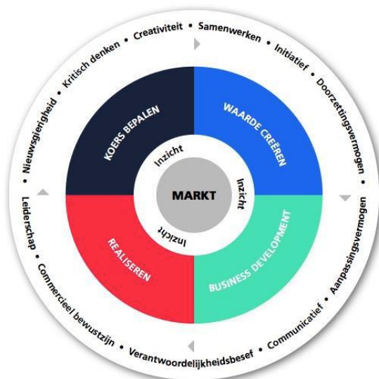
Figuur 1.1. Visualisatie van het landelijke CE beroepsprofiel (Dromen, durven, denken, doen, 2018)

Deze vier leeropbrengsten zijn geformuleerd rondom de kern van inzicht in de markt (zie figuur 1.1). Inzicht in de markt is de vertaling van de Dublin Descriptor 'onderzoekend vermogen'. Daaromheen zijn elf skills geformuleerd, waar de '21 st century skills' in zijn verwerkt. In het figuur hieronder staan de skills vermeld in de buitenste cirkel.