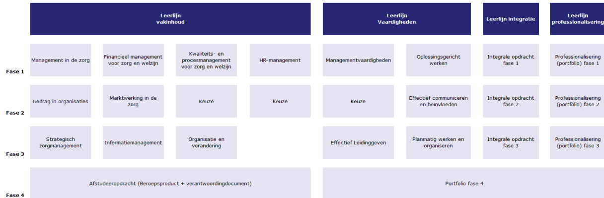
Figuur 1: Schematisch overzicht opleidingsblauwdruk MidZ vanaf september 2019

Met de introductie van de vernieuwde blauwdruk (zie figuur 1) heeft ook de afstudeerfase een nieuwe vorm en invulling gekregen. Deze fase bestaat vanaf september 2019 uit het maken van een afstudeeropdracht in de vorm van een beroepsproduct en het schrijven van een fase 4 portfolio waarin de student verschillende bewijsstukken bijeen neemt.