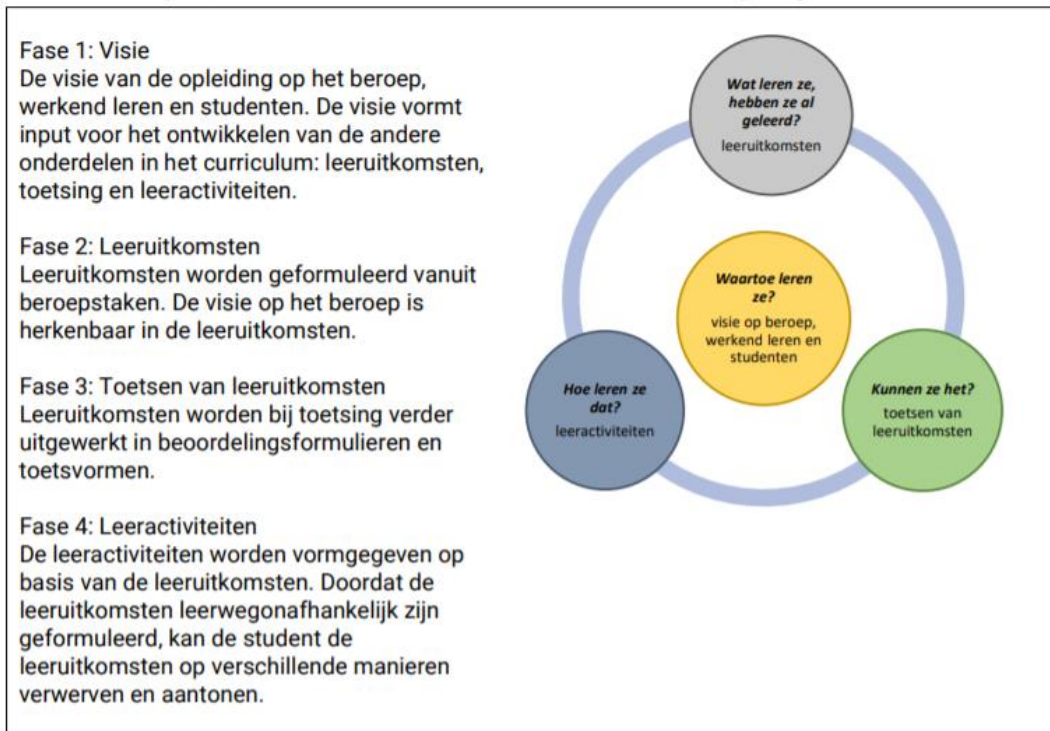
Afbeelding 1: Ontwikkelmodel Flexibele Opleidingstrajecten hoger onderwijs Windesheim, Algemene inleiding (2019)

De dertien opleidingen die met hun deeltijdvariant deelnemen aan het Experiment leeruitkomsten hebben allereerst hun leeruitkomsten ontwikkeld. Deze leeruitkomsten zijn opgesteld aan de hand van de 'Handleiding Leeruitkomsten' (op basis van het Tuning-model) en gegroepeerd in eenheden van leeruitkomsten. Eén of meerdere eenheden van leeruitkomsten (EVL) vormen een voor het werkveld herkenbare module van 30 EC.