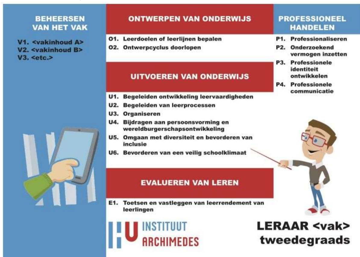
Figuur 1: Generieke raamwerk leeruitkomsten Instituut Archimedes

Het panel stelt vast dat de instellingsvisie op flexibel onderwijs is vertaald naar een onderwijskundig model met leeruitkomsten. Per 1 september 2022 starten de opleidingen Talen in zowel de voltijd- als de deeltijdvariant in studiejaar 1 met het werken met leeruitkomsten. Op het moment van de visitatie is voor alle opleidingen een mooi en helder leeruitkomstenboekje ontwikkeld met een generiek raamwerk van leeruitkomsten dat geldt voor de beroepsvoorbereiding. Het generieke raamwerk van leeruitkomsten is in overleg met het werkveld en met de studenten tot stand gekomen. In onderstaande figuur is het generieke raamwerk uitgebeeld. De leeruitkomsten zijn verdeeld over vijf kerntaken. De generieke kerntaken; 'ontwerpen van onderwijs', 'uitvoeren van onderwijs', 'evalueren van leren' en 'professioneel handelen', gelden voor alle opleidingen. De kerntaak, 'beheersen van het vak' verschilt per opleiding.